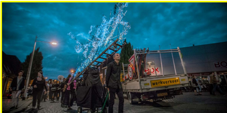
De parade ←

Deze bijzondere traditie van het begraven van de kermis is ontstaan in de 19e eeuw. Toen ging het er wel anders aan toe dan nu. Op de laatste kermisdag werd een speculaaspop op een draagbaar, een plank, gelegd. Aan die plank hingen lege portemonnees, dat was symbolisch. Iedereen had zijn geld uitgegeven op de kermis dus waren de portemonnees leeg. De kermisbegravenis werd toen ook de 'Parade der lege portemonnees' genoemd. De stoet met de speculaaspop en lege portemonnees ging langs alle cafés in het centrum. De begravenis van de kermis kende in ieder geval tot de Tweede Wereldoorlog deze vorm. Pas later is het traditie geworden om in de Piushaven vuurwerk af te gaan steken.