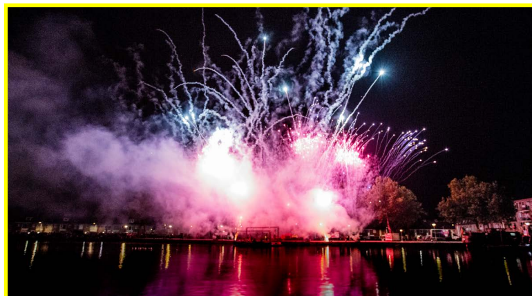
Het traditionele vuurwerk →